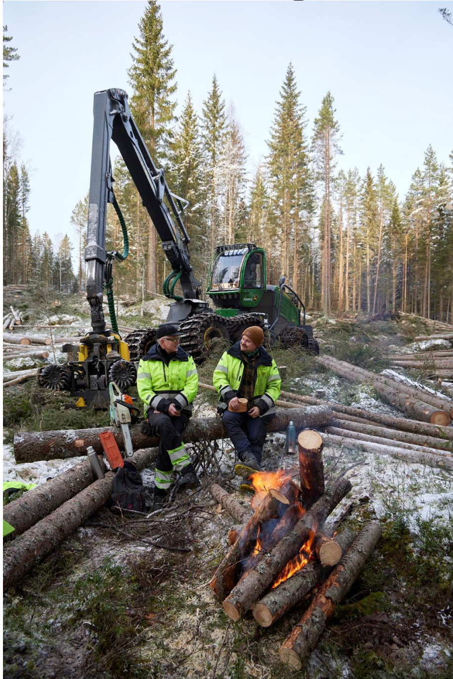
Hogst utført av Holmgren AS