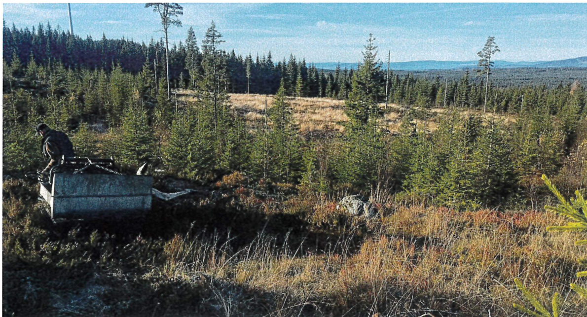
Utkjøring av elg