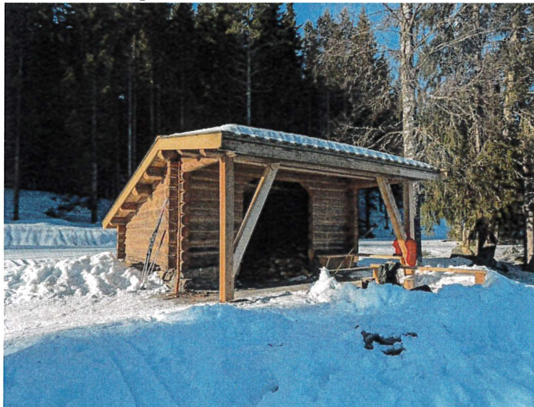
Ny gapahuk ved Utsjøen

Allmenningen har betydelig aktivitet knyttet til fritidsaktiviteter og friluftsliv. Skogsbilvegene er i hovedsak åpne for fri ferdsel store deler av året, mot betaling av bomavgift for kjøretøy.