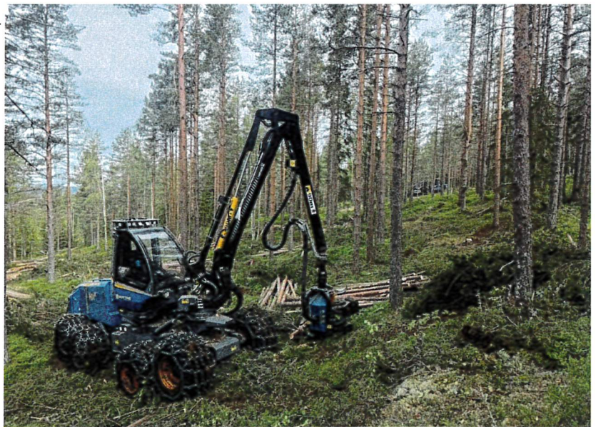
Tynning ved Benketjennet

Eidsvoll Almenning har en oppdatert driftsplan for skogen som tilsier at avvirkningen over tid bør ligge rundt 10.000 m 3 per år de neste årene. Hvis prisene holder seg, og det er driftsforhold som gjør det mulig, vil det hogges i henhold til driftsplanen.