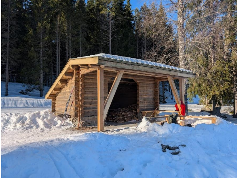
Ny gapahuk ved Utsjøen

Allmenningen har betydelig aktivitet knyttet til fritidsaktiviteter og friluftsliv. Skogsbilvegene er i hovedsak åpne for fri ferdsel store deler av året, mot betaling av bomavgift for kjøretøy.