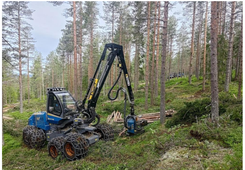
Tynning ved Benkefjennet

Eidsvoll Almenning har en oppdatert driftsplan for skogen som tilsier at avvirkingen over tid bør ligge rundt 10.000 m 3 per år de neste årene. Hvis prisene holder seg, og det er driftsforhold som gjør det mulig, vil det hogges i henhold til driftsplanen.