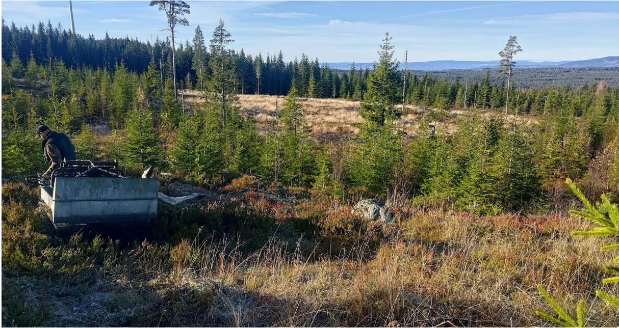
Utkjøring av elg